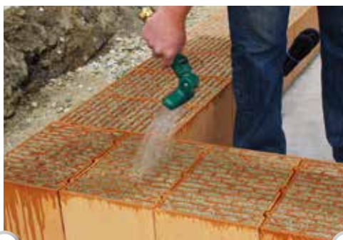
1 Ziegelreihe befeuchten