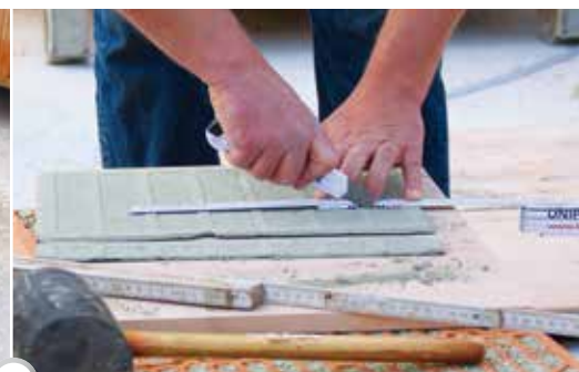
3 Bei Bedarf zuschneiden