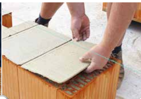
2 Mörtelpads auflegen